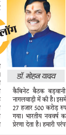
डॉ. मोहन यादव

चैत्र शुक्ल प्रतिपदा से प्रारंभ होने वाला नवसंवत्सर हमारी सांस्कृतिक चेतना, वैज्ञानिक दृष्टि और प्राकृतिक जीवन पद्धति का प्रतीक है। इस वर्ष विक्रम संवत् 2083 का शुभारंभ हुआ है। यह मध्यप्रदेश के लिए गर्व और गौरव का विषय है कि भारतीय कालगणना की गौरवशाली परंपरा उज्जयिनी से प्रारंभ हुई है। सम्राट विक्रमादित्य के राज्याभिषेक से आरंभ हुआ विक्रम संवत् भारतीय संस्कृति की चेतना और राष्ट्र की अस्मिता का प्रतीक है। भारतीय नववर्ष प्रकृति के नवोदय का पर्व है। इस समय प्रकृति नवजीवन से समृद्ध होती है, पृथ्वी पर नवचेतना और नवसृजन का संचार होता है। देश भर में मनाए जाने वाले नवसंवत्सर के विभिन्न नाम हैं। इसी दिन से चैत्र नवरात्र का भी शुभारंभ होता है। नवरात्र के नौ दिन साधना, आत्मशुद्धि और शक्ति उपासना का अवसर है। भारतीय जीवन पद्धति में पर्व और परंपराएं व्यक्ति