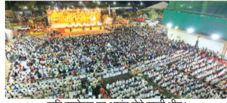
कवि सम्मेलन का आनंद लेने उमड़ी भीड़।