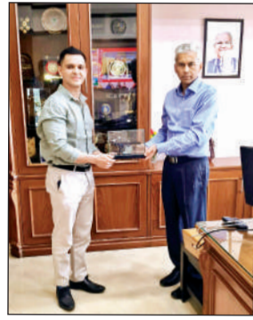
इको-सिस्टम को बढ़ावा देने में महत्वपूर्ण भूमिका होगी। आईजीआई कंपनी भारत में नौनो और माइक्रो श्रेणी के ड्रोन सेगमेंट में

मद्र सरकार की ड्रोन नीति के तहत राज्य में अपने मैनुफैक्चरिंग ऑपरेशंस की शुरुआत कर रही है। आईजीआई मद्र में इस स्तर पर ड्रोन निर्माण शुरू करने वाली शुरुआती कंपनी है। ये उन्नत ड्रोन सर्विलांस, टेक्नीकल मिशन, इन्फ्रा-स्ट्रक्चर निरीक्षण, सर्वेक्षण तथा विभिन्न औद्योगिक और सुरक्षा उपयोगों के लिए डिजाइन किए गए हैं। ये ड्रोन जी पी ए - डि ना इ ड (जीपीएस/डिनाइड) परिस्थितियों में भी प्रभावी रूप से संचालन करने में सक्षम होंगे, जिससे इनका उपयोग रक्षा और संवेदनशील क्षेत्रों में और अधिक महत्वपूर्ण होगा।