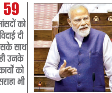
राज्यसभा के सभापति सीपी राधाकृष्णन

59 सांसदों को विदाई दी इसके साथ ही उनके कार्यों को सराहा भी