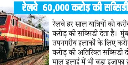
रेलवे 60,000 करोड़ की सब्सिडी दे रहा

भारतीय रेलवे यात्रियों को किफायती यात्रा उपलब्ध कराई जा रही