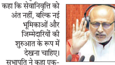
राज्यसभा के सभापति सीपी राधाकृष्णन

राज्यसभा के सभापति सीपी राधाकृष्णन ने सेवानिवृत्त हो रहे 59 सांसदों को विदाई देते हुए