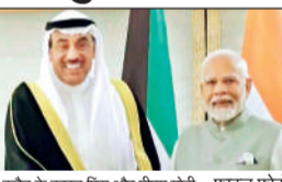
कुवैत के फ्राउन प्रिंस और पीएम मोदी, फाइल फोटो

पश्चिम एशिया में बढ़ते तनाव के बीच पीएम नरेंद्र मोदी ने बुधवार को कुवैत के साथ उच्चस्तरीय कूटनीतिक संवाद को आगे बढ़ाते हुए वहां के फ्राउन प्रिंस, शेख सबाह अल-खालिद अल-हमद अल-मुबारक अल-सबाह से फोन पर बात की और ईद के आने वाले त्योहार पर उन्हें शुभकामनाएं दीं। इसके अलावा बातचीत में पीएम मोदी ने फ्राउन प्रिंस से क्षेत्रीय शांति और समुद्री सुरक्षा पर भी बातचीत की। पीएम ने खुद इस बातचीत का जानकारी ट्वीट कर दी है।