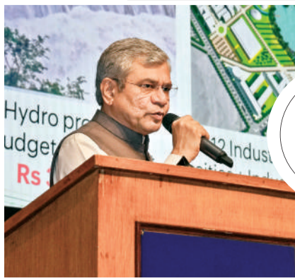
फैसलों की मीडिया को जानकारी देते मंत्री अश्विनी वैष्णव

कपास एमएसपी (2023-24): कैबिनेट ने कपास सीजन 2023-24 के दौरान न्यूनतम समर्थन मूल्य (एमएसपी) संचालन पर हुए 1,718 करोड़ के खर्च की प्रतिपूर्ति को मंजूरी दे दी है। यह निर्णय किसानों को समर्थन देने के लिए लिया गया था, क्योंकि अक्टूबर 2023 से सितंबर 2024 तक चले इस सीजन में कपास की कीमतें एमएसपी से नीचे गिर गई थीं। सरकार ने भारतीय कपास निगम (सीसीआई) के माध्यम से किसानों से एमएसपी पर कपास की खरीद की। इस खरीद से 7.25 लाख किसानों को सीधा लाभ मिला। कुल 33 लाख गांठें कपास खरीदी गईं। इन खरीदों के माध्यम से किसानों को कुल 11,712 करोड़ की सहायता प्रदान की गई। कपास सीजन 2023-24 में भारतीय किसानों ने कुल 325 लाख गांठें कपास का उत्पादन किया था।