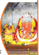
मां के दर्शन कर मांगते हैं मन्तव्य

भोपाल से 70 किलोमीटर दूर प्रसिद्ध शक्तिपीठ बिजासन धाम सलकनपुर में चैत्र नवरात्रि में करीब 5 लाख श्रद्धालु माता बिजासन के धाम पहुंचेंगे। माता बिजासन के दर्शन कर अपनी मन्तव्य मांगेंगे। लाखों की संख्या में श्रद्धालु माता बिजासन के दर्शन करने हर वर्ष आते हैं। बिजासन धाम सलकनपुर में माता बिजासन के दर्शन करने के लिए यहां पर सड़क मार्ग, रोववे सहित सीड़ियों से भी माता के दर्शन करने लोग पहुंचते हैं। वैसे तो यहां पर साल ▶▶शेष पेज 4 पर