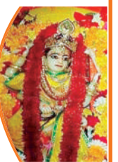
मंदिर के चारों द्वार खोल दिए जाएंगे

विश्व प्रसिद्ध तंत्रिक शक्तिपीठ मां पीतांबरा मंदिर में चैत्र नवरात्रि पर्व की तैयारियां पूरी कर ली गई हैं। गुरुवार से आरंभ हो रहे इस पावन पर्व पर दतिया का माहौल देवी भक्ति और आस्था से सराबोर होगा। मंदिर के चारों मुख्य द्वार आकर्षक सजावट के साथ भक्तों के लिए खोल दिए जाएंगे। देशभर से साधक और श्रद्धालु मां पीतांबरा के दर्शन के लिए दतिया पहुंच रहे हैं। मंदिर से मंत्र दीक्षा प्राप्त साधकों को किसी प्रकार की परेशानी न हो, इसके लिए ▶▶शेष पेज 4 पर