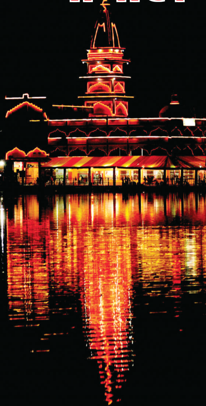
चैत्र नवरात्र आज से, सज गए मंदिर...