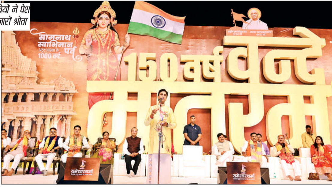
हिंदू नववर्ष के स्वागत में आयोजित अखिल भारतीय कवि सम्मेलन पहुंचे कवि कुमार विश्वास कविता पाठ करते हुए।

पूरे कार्यक्रम के दौरान उत्साह, ऊर्जा और सांस्कृतिक गौरव का वातावरण बना रहा। श्रोताओं की भारी भीड़ और लगातार गूंजती तालियों ने कवियों का उत्साह बढ़ाया, जिससे मंच और पंडाल देर रात तक काव्यमय बना रहा।