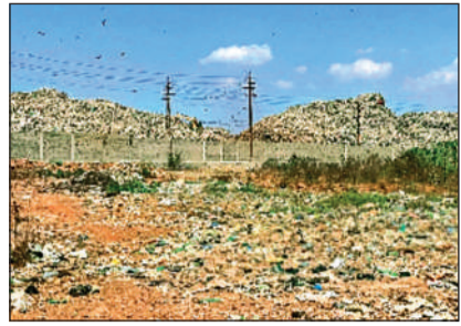
टन कचरे के निपटान के लिए 55.54 करोड़ रुपए की लागत से बायोमाइनिंग प्रोजेक्ट शुरू किया जाएगा। यह कचरा वर्षों से पर्यावरण और आसपास के लोगों के लिए समस्या बना हुआ है। वैज्ञानिक तरीके से इसके निपटान से शहर को बड़ी राहत मिलने की उम्मीद है।

नगर निगम के आईएसवीटी सभागार में 23 मार्च को होने वाली परिषद की बैठक के लिए जारी एजेंडे में आदमपुर में 6 लाख मीट्रिक टन कचरे के निपटान के लिए 55.54 करोड़ के बायोमाइनिंग प्रोजेक्ट शुरू करने सहित नई पार्किंग और कंडम वाहनों की नीलामी के बिंदु शामिल किए गए हैं। इन विषयों पर परिषद में होगी चर्चा। वहीं शहर की सफाई, ट्रैफिक और इंफ्रास्ट्रक्चर से जुड़े कई बड़े मामलों पर मुहर लग सकती है। बैठक में विपक्ष ने स्टाटर हाउस मुद्दे को लेकर सलाहकों को घेरने की तैयारी की है। हालांकि एजेंडे में जनहित से जुड़ा कोई मुद्दा शामिल नहीं किया गया है। परिषद की बैठक के लिए आदमपुर छावनी स्थित डेप साइट को खत्म करने का बड़ा प्रस्ताव भी रखा गया है। करीब 6 लाख मीट्रिक