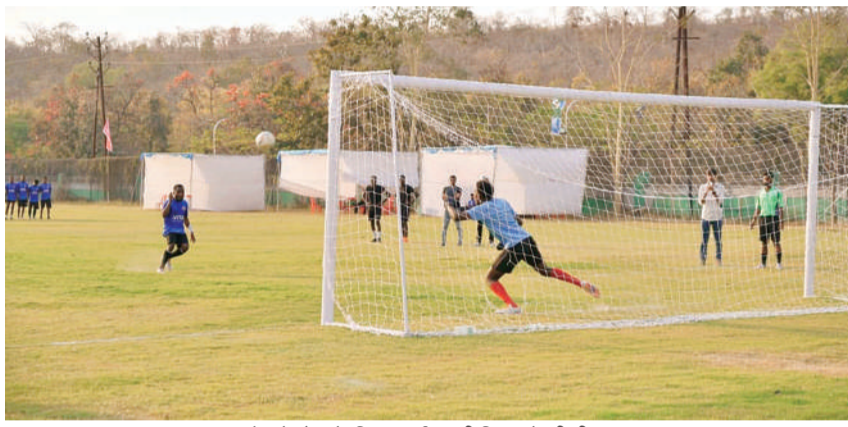
मैच में गोल के लिए संघर्ष करती जिम्बाब्वे की टीम।