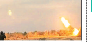
पिनाका एक्सटेंडेड रेंज रॉकेट का सफल परीक्षण

रक्षा क्षेत्र में आत्मनिर्भर भारत की तरफ देश ने एक और बड़ा कदम बढ़ाया है। राजस्थान के पोखरण में सोलर ग्रुप ने पिनाका एक्सटेंडेड रेंज रॉकेट्स का सफल परीक्षण करके रक्षा क्षेत्र में नया इतिहास रचा है। कंपनी ने पहली बार पिनाका एक्सटेंडेड रेंज रॉकेट के दो उत्पादन बैचों का सफलतापूर्वक परीक्षण किया है। यह महत्वपूर्ण परीक्षण राजस्थान की पोखरण फ़ील्ड फायरिंग रेंज में किया गया। सोलर ग्रुप ने बताया कि इस दौरान कुल 24 पिनाका एन-एचएस रॉकेट्स का परीक्षण किया गया। इन रॉकेट्स का सटीकता, स्थिरता और मारक क्षमता को परखा गया। कंपनी के अनुसार, सभी रॉकेट्स ने मैदान परिस्थितियों में असाधारण रूप से बहुत अच्छा प्रदर्शन किया और अपने सभी लक्ष्यों को सफलतापूर्वक पूरा किया। यह पहली बार है जब पिनाका एक्सटेंडेड रेंज रॉकेट्स के उत्पादन बैचों का परीक्षण किसी निजी कंपनी द्वारा सफलतापूर्वक किया गया है। यह निजी क्षेत्र की बढ़ती क्षमता और आत्मनिर्भरता का बड़ा प्रमाण है।