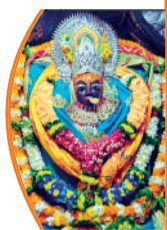
650 पुलिस कर्मियों की तैनाती की गई