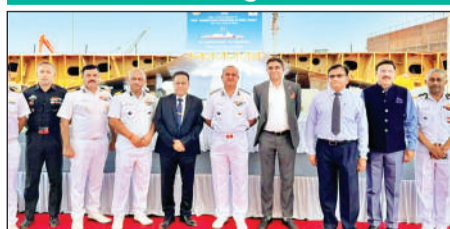
ओपीवी के निर्माण समारोह में उपस्थित आईसीजी के शीर्ष अधिकारी

नेक्स्ट जेनरेशन पोत 5,000 समुद्री मील की रेंज और 23 समुद्री मील की अधिकतम गति हासिल करने में सक्षम होंगे। करीब 117 मीटर लंबे इन पोतों में 11 अधिकारियों और 110 जवानों के रहने की क्षमता होगी। इनमें एआई-आधारित पूर्वनिर्माणित रखरखाव प्रणाली, रिमोट पायलट ड्रोन, एडिटेड डिजिटल सिस्टम और एडिटेड डिजिटल फ्लोटप्लैट मैनेजमेंट सिस्टम जैसी आधुनिक तकनीकें शामिल होंगी। यह परियोजना महानगव डोक शिपबिल्डर्स लिमिटेड (एमडीएल) द्वारा बाय (इंडियन-आईडीडीएम) क्षमता के तहत स्वदेशी रूप से डिजाइन और विकसित की जा रही है। छह नेक्स्ट जेनरेशन ओपीवी के निर्माण का अनुबंध 20 दिसंबर 2023 को संपन्न हुआ था।