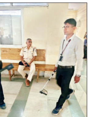
महीनेभर में पीपुल्स और पासपोर्ट कार्यालय को बम से उड़ाने की धमकी भरा मेल आ चुका है। इसके अलावा मौसम विभाग को भी बम से उड़ाने की धमकी मिली थी।

राजधानी के कोर्ट, जेके हॉस्पिटल, पीपुल्स यूनिवर्सिटी, आईसर, अटल बिहारी वाजपेयी यूनिवर्सिटी, सहित नानपोल विभाग और पासपोर्ट कार्यालय को बम से उड़ाने का धमकी भरा मेल आया है। यह जानते हुए भी मेल फर्जी है। पुलिस की बम स्वर्बांड टीम ने दफ्तरों की खाली कराकर गहन चेकिंग की। चेकिंग में धमकी भरा मेल अफवाह निकला। उल्लेखनीय है कि धमकी भरा मेल भेजने की यह कोई पहली घटना नहीं है। इससे पूर्व भी