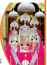
तंत्रिक साधना का यह आदर्श स्थान

चैत्र नवरात्रि को लेकर मां बगलामुखी मंदिर में तैयारियां पूर्ण हैं। इस बार मंदिर में लाखों श्रद्धालुओं के पहुंचने का अनुमान जताया जा रहा है, जिसे देखते हुए मंदिर प्रशासन ने व्यापक इंतजाम किए हैं। मंदिर परिसर को आकर्षक सजा-सज्जा से सजाया जा रहा है और विशेष विद्युत व्यवस्था भी की गई है, ताकि श्रद्धालुओं को किसी प्रकार की असुविधा न हो। दर्शन व्यवस्था को सुगम बनाने के लिए जगह-जगह बेरिकेडिंग की गई है। वहीं सुरक्षा ▶▶शेष पेज 4 पर