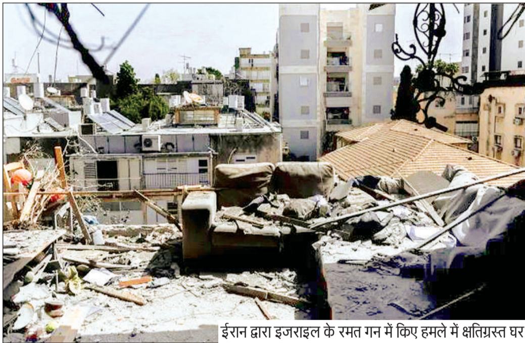
ईरान द्वारा इजराइल के रमत गन में किए हमले में क्षतिग्रस्त घर

2 लेबनान में हिज्बुल्लाह के खिलाफ लड़ाई और तेज करेगा इजराइल