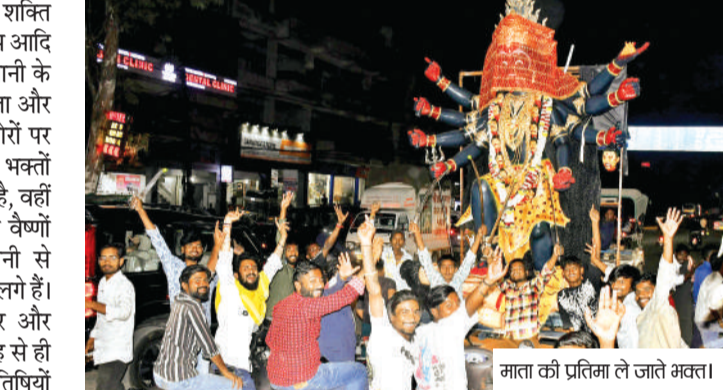
माता की प्रतिमा ले जाते भक्त।

इधर राजधानी के देवी मंदिरों में आकर्षक साज-सज्जा और धार्मिक आयोजनों की तैयारियां जोरों पर हैं। उधर व्रत और साधना के लिए भक्तों के मन में अपार उत्साह की झलक दिखाई दे रही है।