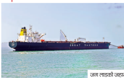
जग लाडकी जहाज

अपने व्यापारिक हितों की रक्षा करते हुए भारत ऑपरेशन संकल्प के तहत इन जलक्षेत्रों में अपनी नौसैनिक उपस्थिति लगातार बनाए हुए हैं। यह पहल महत्वपूर्ण शिपिंग रूट्स की सुरक्षा सुनिश्चित करने और जग लाडकी जैसे जहाजों की सुरक्षित डॉकिंग सुनिश्चित करने के लिए समर्पित है। साथ ही शिपिंग महानिदेशालय जहाज मालिकों, भर्ती और प्लेसमेंट सेवा लाइसेंस एजेंसियों और इस क्षेत्र में मौजूद भारतीय राजनयिक मिशन के साथ समन्वय स्थापित करते हुए स्थिति पर बारीकी से नजर रख रहा है। ▶▶पढ़ें पेज 11 भी