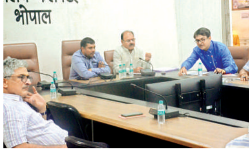
सांसद का विरोध, कलेक्टर को लिखा पत्र