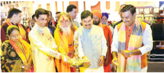
प्रधानमंत्री के सपनों को साकार कर रहे हैं डॉ. मोहन